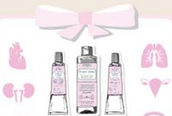
MAPA AKNÉ ako mu predišť str. 4