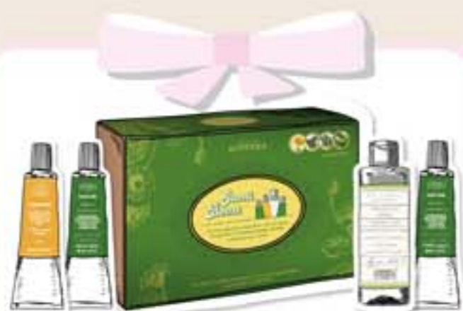
JARNÝ BOOST baliček s vôňou jari str. 2