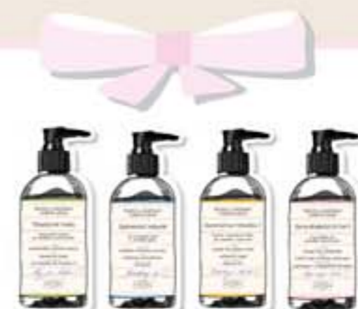
ČISTENIE PLETI ranné a večerné rituály sebalásky str. 6 a 7